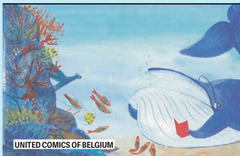
UNITED COMICS OF BELGIUM