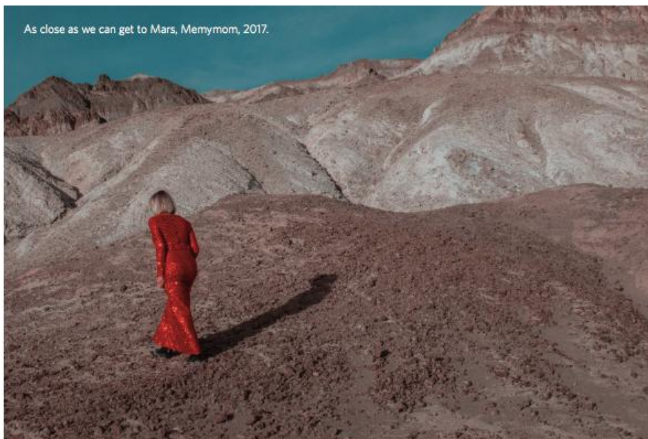
As close as we can get to Mars, Memymom, 2017.